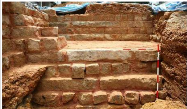
前中央書院地基遺跡