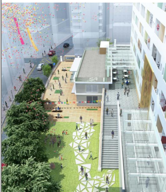
位於智方天台的空中花園