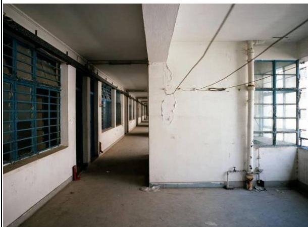
宿舍大樓內的住宅單位